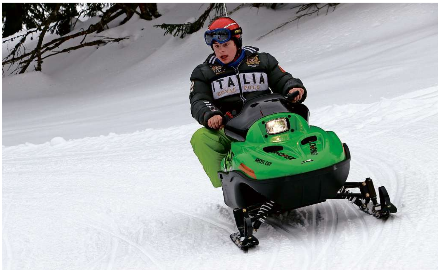
Ein Tag im Schnee gehört genauso zu den Freizeitaktivitäten von Insieme Cerebral Graubünden, wie die Adventswochenenden und der Jugendtreff.